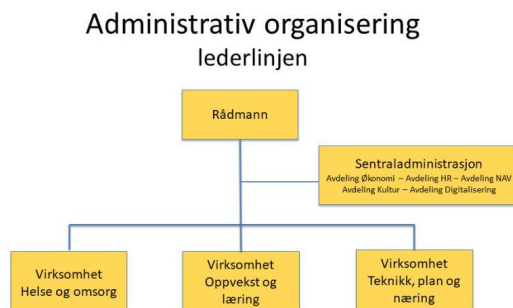
Figur 1: Administrativ organisering i Eidskog kommune

De kommunale tjenestene innen arbeids- og velferdsetaten har ansvar for å tilby sosiale tjenester og veiledning ved NAV-kontoret. Formålet med disse tjenestene er blant annet å fremme økonomisk og sosial trygghet, bedre levekårene for vanskeligstilte, bidra til økt likeverd og likestilling, forebygge sosiale problemer. I figur 3.1 under, ser vi NAV Eidskogs plassering i Eidskog kommune: